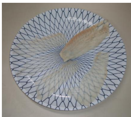
カンパチスライス