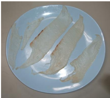
カンパチスライス