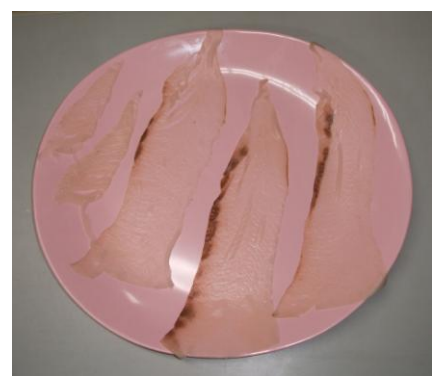
カンパチスライス